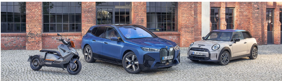
Es gelten die aktuellen Servicebeschreibungen der Alphabet Fuhrparkmanagement GmbH.